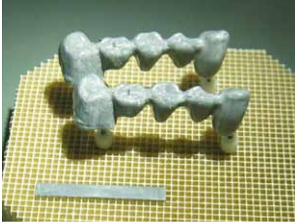
simplibond NF dünn deckend aufgetragen

(unterschiedliche Farbgebungen der Paste haben kein Einfluss auf das Ergebnis)