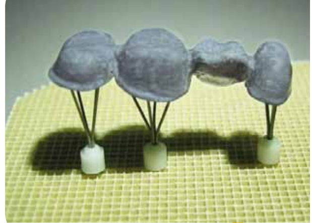
simplibond NF gebrannt

(unterschiedliche Farbgebungen der Paste haben kein Einfluss auf das Ergebnis)